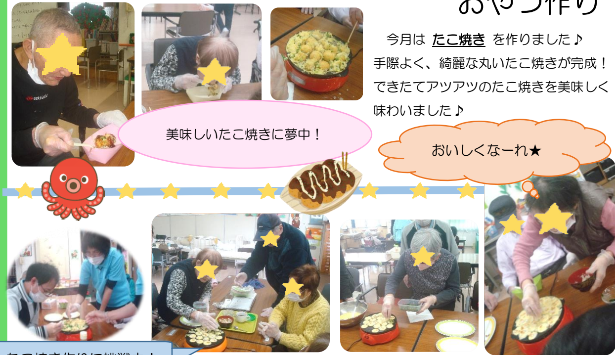
たこ焼き作りに挑戦中！