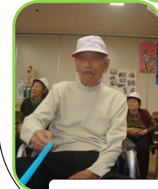
★テープ引きゲーム★