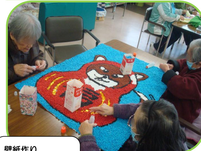
壁紙作り コツコツと皆で 頑張っています☆