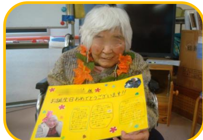
＊メッセージカード＊