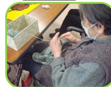
編物 袋を作っています