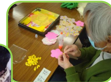
梅の花作り もうすぐ満開！