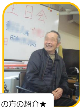
★誕生日の方の紹介★