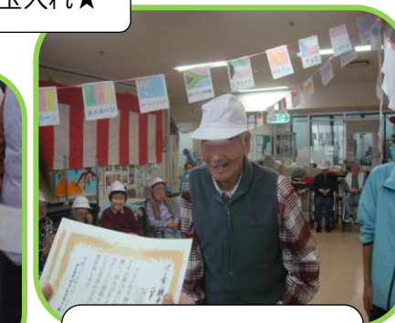
個人賞 パン食い競争一等賞！