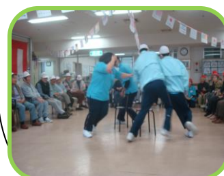
★アイス取りゲーム★